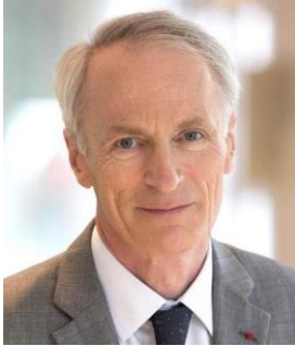
Jean-Dominique SENARD Yönetim Kurulu Başkanı

Daha etik, daha adil, daha insancıl olmak bireysel yada kollektif olarak Renault Grubu'nu Sürdürülebilir bir şekilde büyütmek ve hedeflerimize ulaşmada bizi güçlü kılacak.