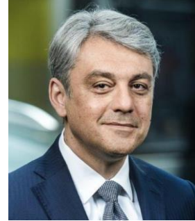
Luca DE MEO CEO